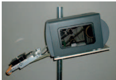
Vue latérale du système AL 775