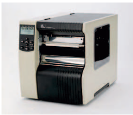
La version 140Xi4™