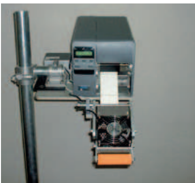
La solution AL 775 choisie

Pour un client opérant dans la fabrication de pâtes alimentaires, un intégrateur a fait appel à Eticoncept pour résoudre une problématique d'étiquetage de cartons en sortie de ligne, problématique soumise à une contrainte majeure : opter pour un système à la fois fiable et simple capable de fonctionner avec un minimum d'interventions techniques en cours de production.