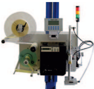
La solution proposée, APV3000 NV

Ce modèle, nouvellement proposé par ETICONCEPT, permet une application de l'étiquette « à la volée » lors du passage de l'emballage. L'impression et la pose sont réalisées en temps réel : la dernière étiquette imprimée est celle qui est posée sur le produit.